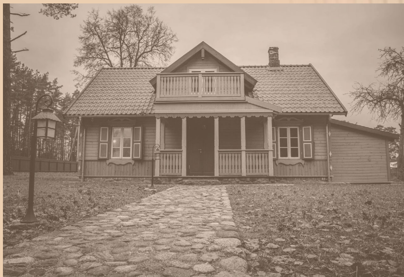
👉 Dom Józefa Mackiewicza (Fundacja Wileńszczyzna)