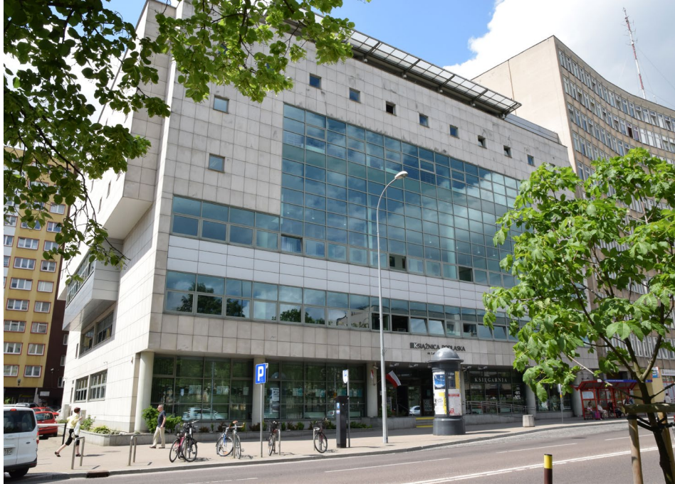
👉 Budynek Książnicy Podlaskiej (Bogumiła Maleszewska-Oksztol)