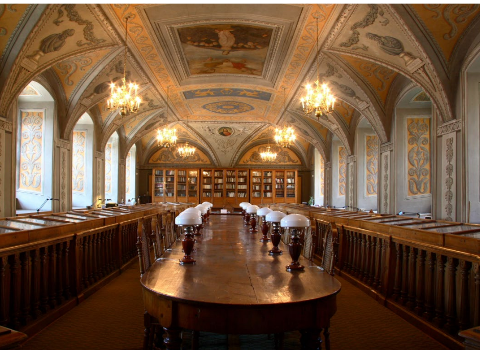
👉 Sala Franciszka Smuglewicza w Bibliotece Uniwersytetu Wileńskiego (domena publiczna)